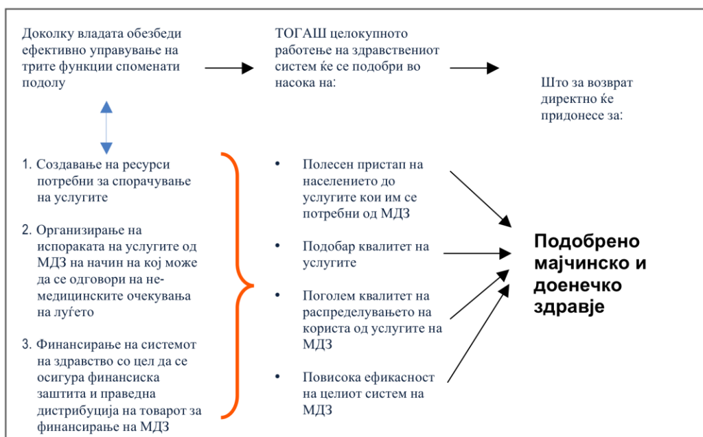
Слика 2: Рамка за зајакнување на здравствените системи, СЗО, 2000 година 6

Главните начела на оваа Стратегија за обезбедување висококвалитетни перинатални услуги се: 7