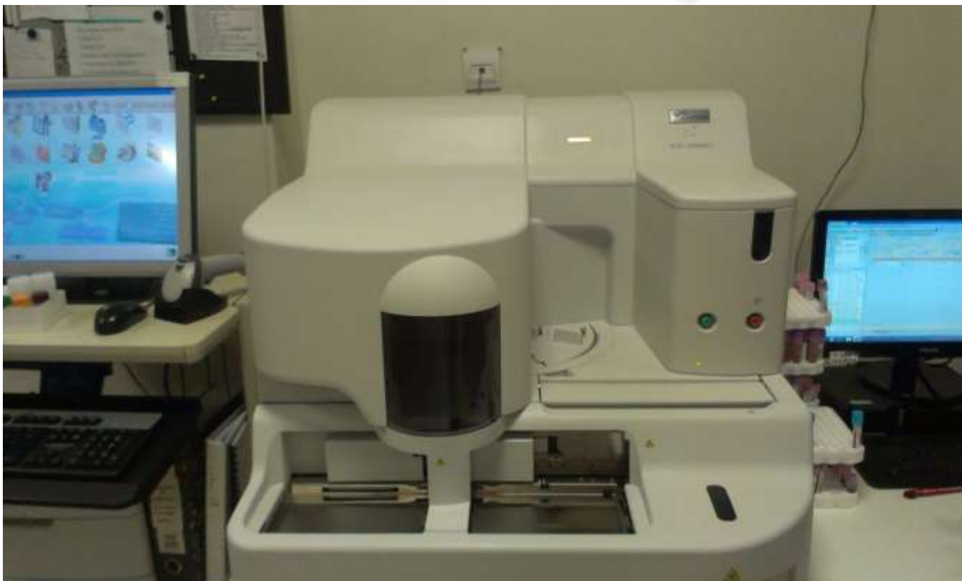
SYSMEX cs – 2000i