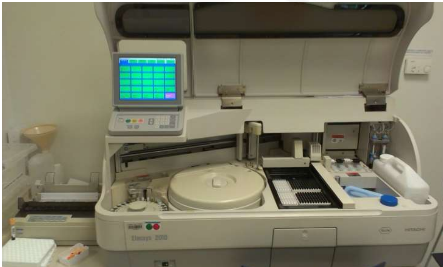
HITACHI Elecsys 2010