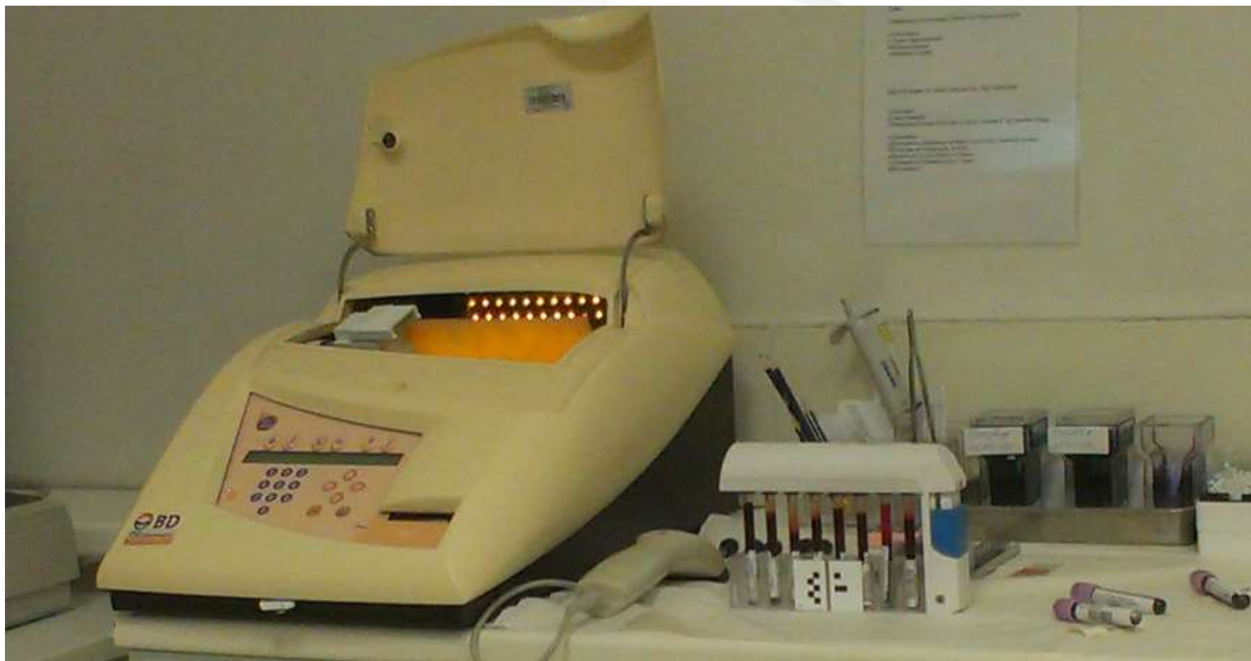
АПАРАТ BD SEDI – 15 НАМЕНЕТ ЗА ИСПИТУВАЊЕ НА СЕДИМЕНТАЦИЈА