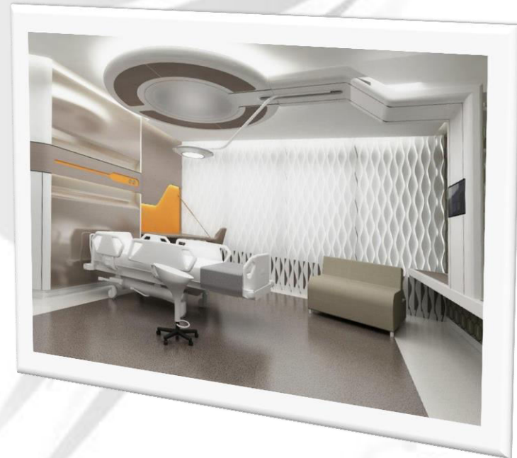
Слика1. Болничка соба