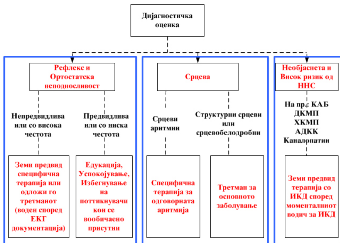
Графикон 3. Третман на синкопа.

АДКК=аритмигена деснокоморна кардиомиопатија; ДКМП=дилатациона кардиомиопатија ЕКГ=електрокардиограм; ИКД=имплантибилен кардиовертер дефибрилатор; КАБ= коронарна артериска болест; ННС=ненадејна срцева смрт; ХКМП=хипертрофична кардиомиопатија.