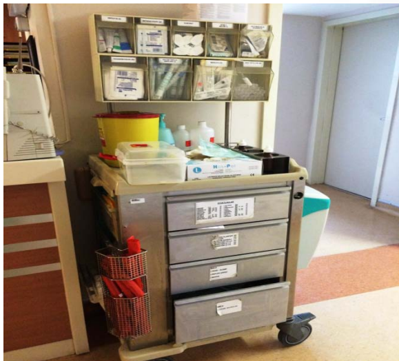
Количка за преврски