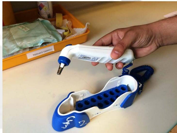
Апарат за мерење температура