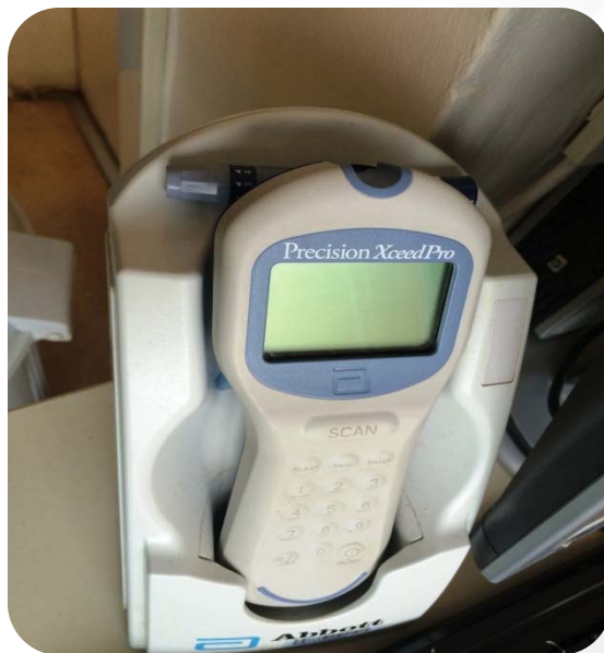
Апарат за мерење на гликемија