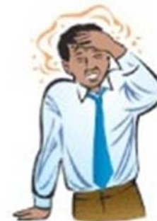
Вртоглавица и потење