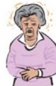
Слабост и стомачен дискомфорт