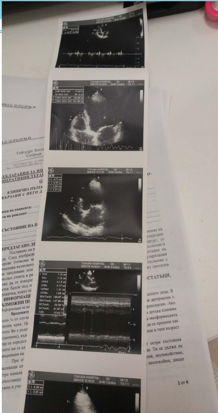
Сликовен приказ на ехокардиографски преглед(пропратен во склоп на извештајот)