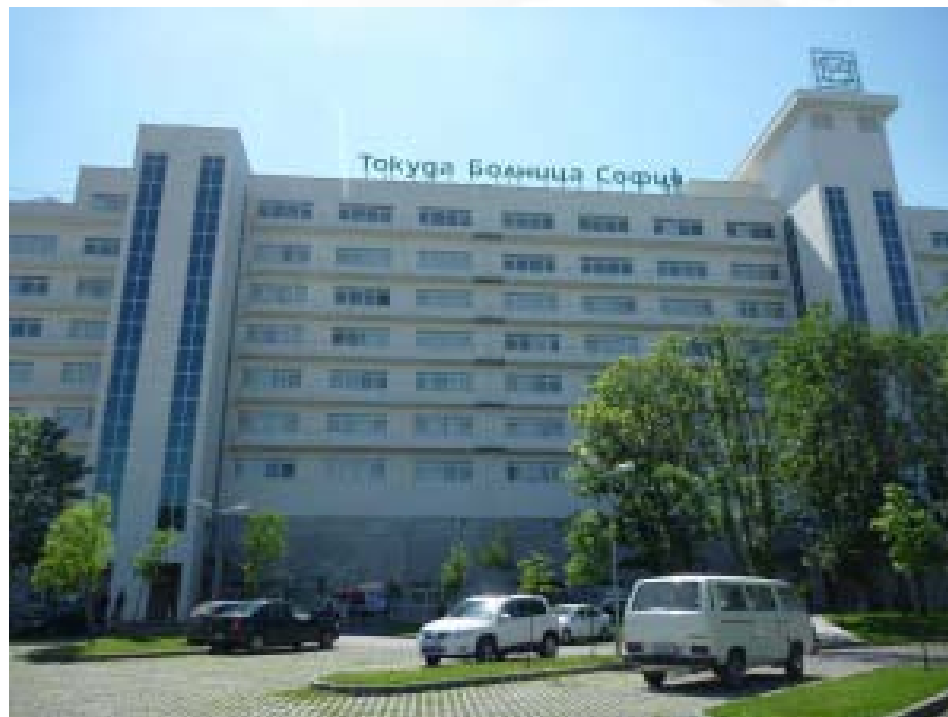
Болницата Токуда Софија