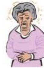
Слабост и стомачен дискомфорт