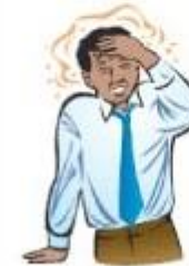
Вртоглавица и потење