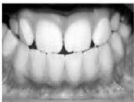
Многу блага форма