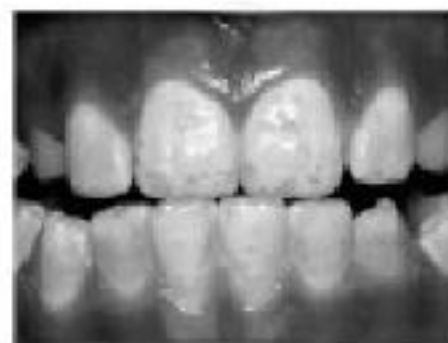
Умерено изразана флуороза