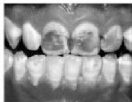
Силно изразана флуороза