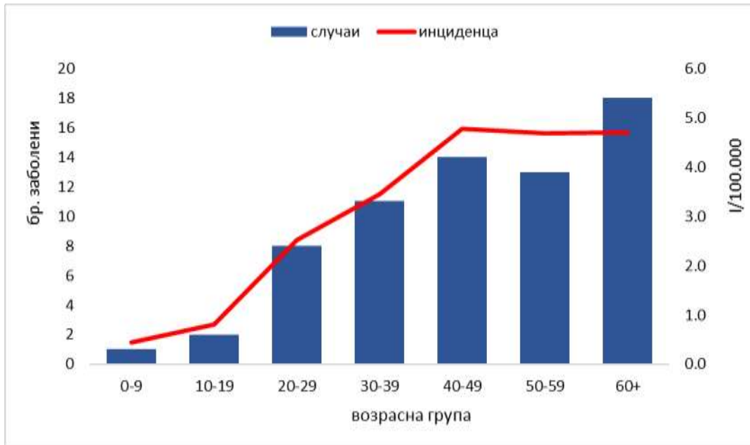
Графикон 1. Дистрибуција на заболениите од COVID-19 според возрастна група, (n=67)

Во однос на датумот на пријавување, првиот случај е регистриран во 9-та недела, а од 11-тата недела во 2020 континуирано се регистрираат нови потврдени случаи. Највисок број на пријавени случаи на дневно ниво (n=19) е регистриран на 19.03.2020 (Графикон 2).